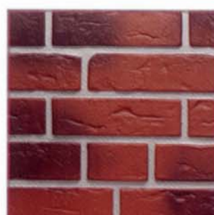
Rustika, ziegelrot geflämmt